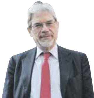
Claudio De Vincenti, sottosegretario allo sviluppo economico

Gli studi legali d'affari giudicano favorevolmente le correzioni apportate alla normativa in materia di azioni collettive, ma hanno dei dubbi sul loro utilizzo